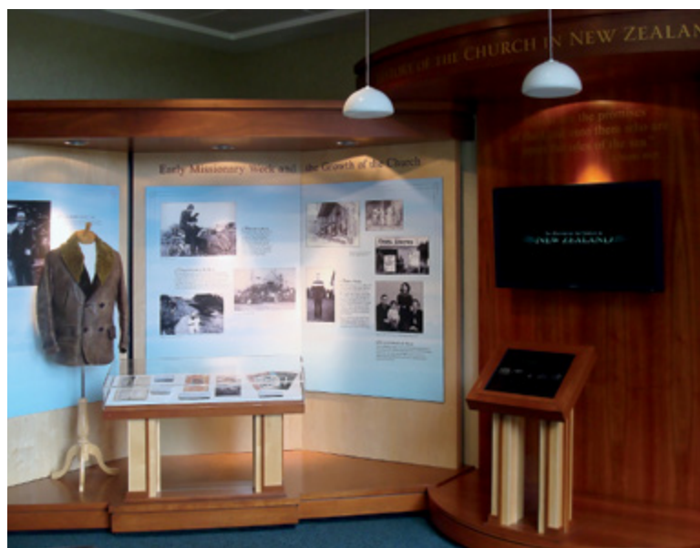
(Ci-dessus) Le Musée d'histoire de l'Église à Salt Lake City (Utah, États-Unis) (Ci-dessous) Une exposition au centre d'accueil des visiteurs du temple de Nouvelle-Zélande.