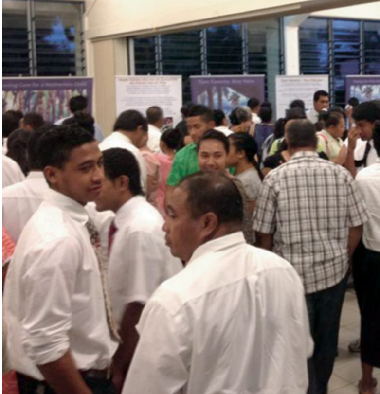
(Ci-dessus et ci-dessous à gauche) Une exposition itinérante dans les Samoa.

En supposant que l'exposition soit organisée dans un bâtiment utilisé simultanément à d'autres fins, réfléchissez aux conséquences de la circulation des personnes et des fonctions du bâtiment sur l'expérience des visiteurs. Les gens seront-ils en mesure de trouver l'exposition ? Pouvez-vous éviter le bruit excessif et les autres distractions ?