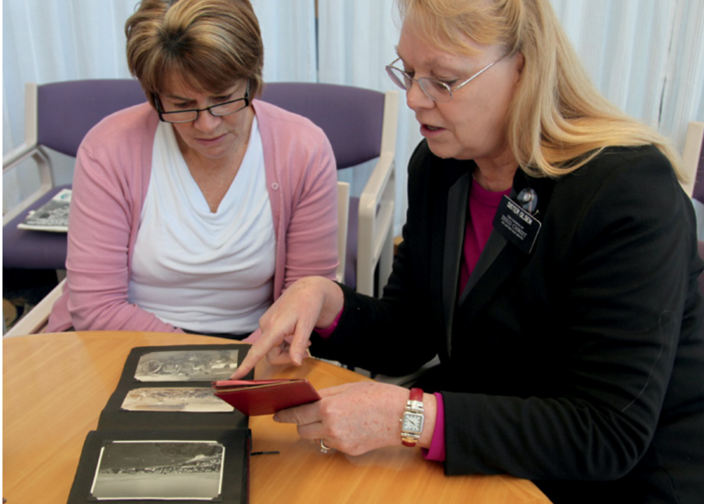
(Au-dessus et en bas à gauche) Cherchez des histoires et des objets pouvant être utilisés pour communiquer visuellement votre thème et des messages clés.