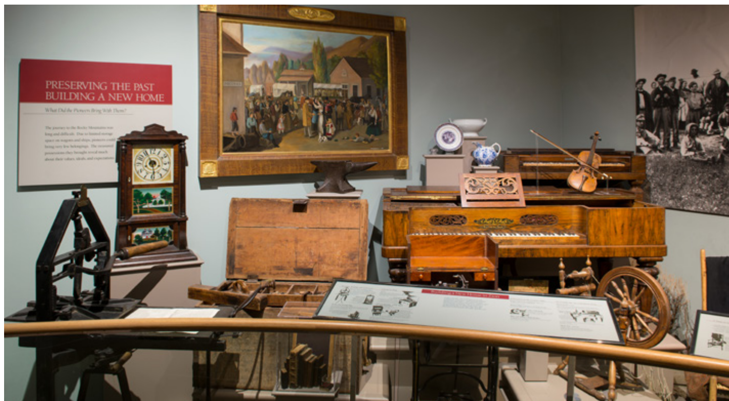
Musée de l'histoire de l'Église, (Utah, États-Unis).