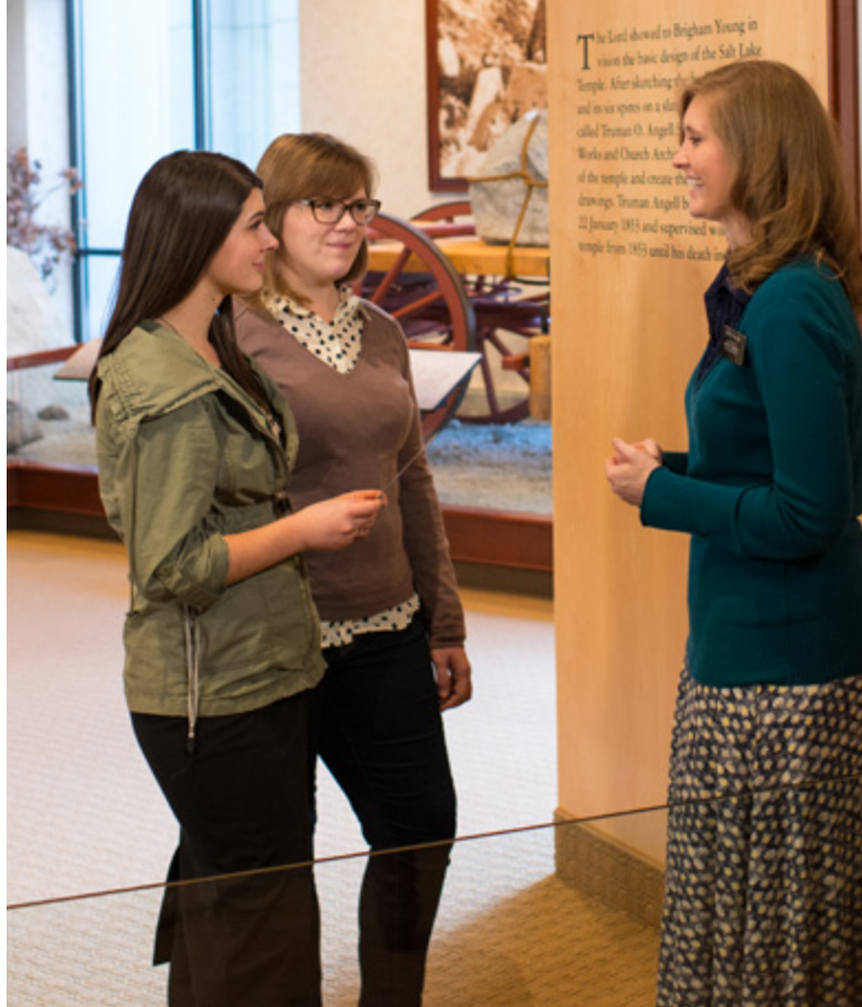
(Ci-dessus) Des Jeunes Adultes découvrent l'histoire de l'Église par l'intermédiaire (En bas à gauche) Des enfants recopient les messages d'une exposition aux

Collectez les retours et les suggestions de vos visiteurs en utilisant des fiches de commentaires, les réseaux sociaux, ou des enquêtes à la sortie de l'exposition. Ces retours vous aideront à faire des ajustements immédiats et vous donneront également des idées sur la façon d'améliorer votre prochaine exposition.