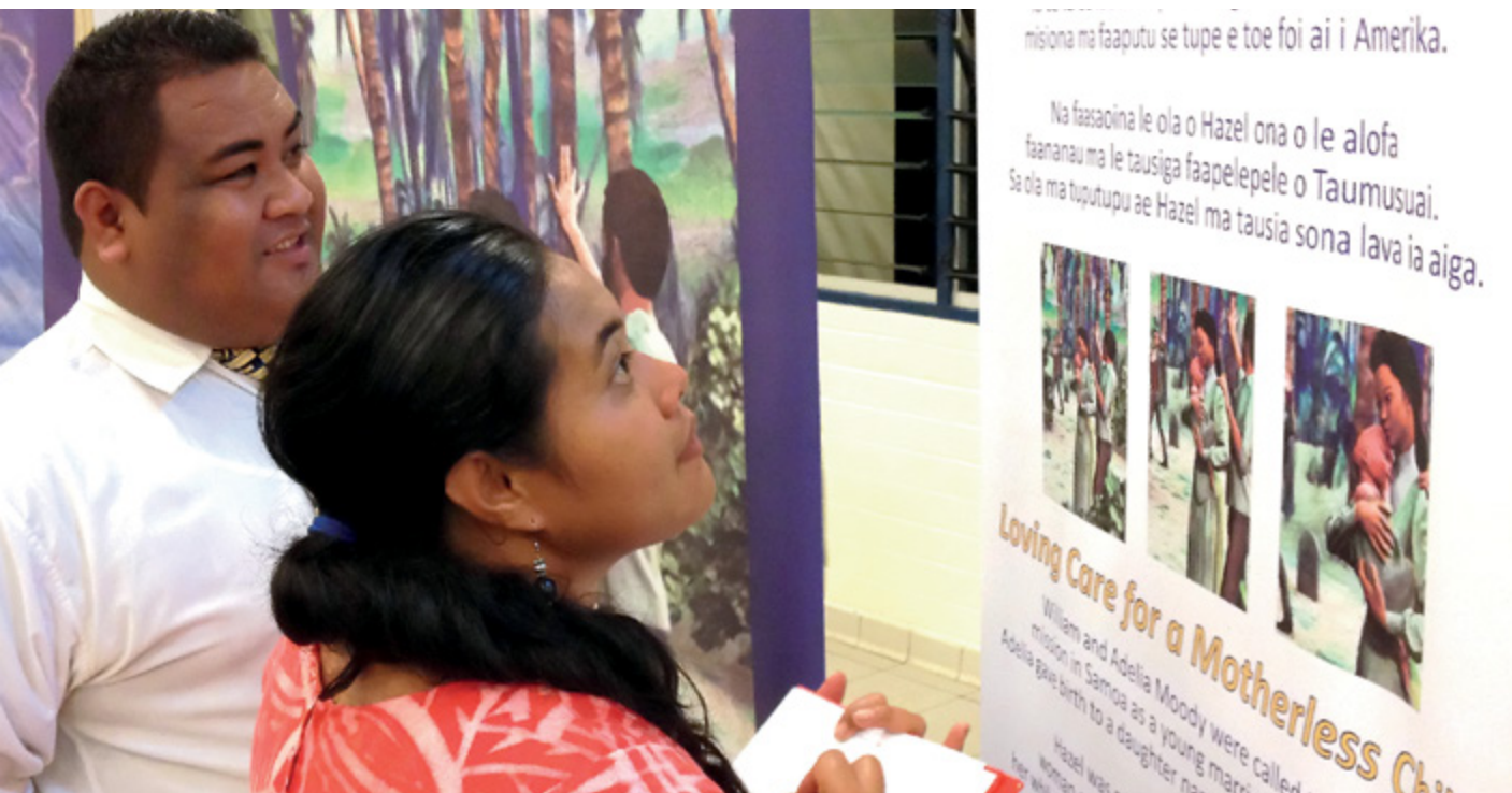
Un mari et son épouse dans les Samoa découvrent l'histoire de l'Église lors d'une exposition itinérante.

Il existe, au-delà des livres et des articles, bien d'autres façons de faire connaître l'histoire de l'Église. Les expositions s'avèrent être un choix judicieux lorsque vous souhaitez faire connaître l'histoire de l'Église à un public aussi vaste que varié. Beaucoup de gens apprennent mieux en voyant, en écoutant et en faisant l'expérience d'une chose. Les expositions peuvent vous aider à communiquer de façon plus efficace avec ces personnes-là. De plus, l'utilisation d'objets authentiques et de récits individuels peuvent constituer de puissants moyens d'édifier la foi et d'accroître la compréhension des gens.