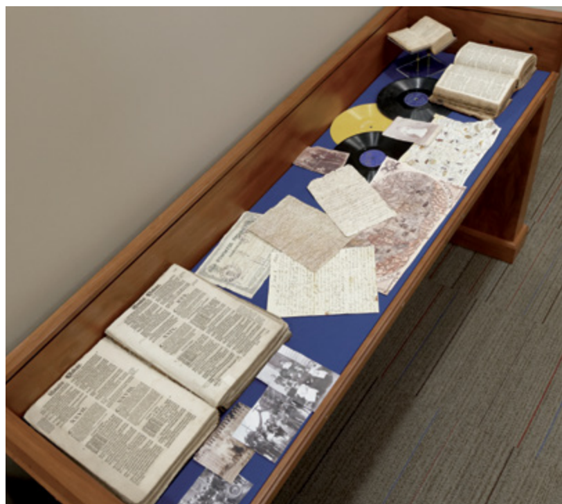
Le cas ci-dessous montre un exemple où les éléments sont disposés de façon inefficace et trop dense. Dans le cas ci-dessous, il y a certes moins d'éléments à présenter, mais chaque élément a plus d'impact car les visiteurs peuvent se concentrer sans distraction sur chacun d'eux.