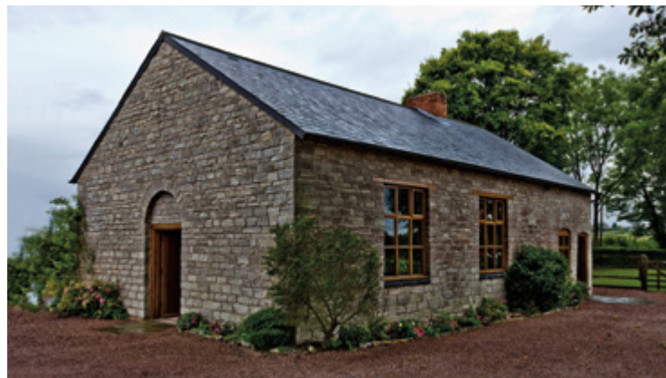
La chapelle de Gadfield Elm, premier lieu de culte de l'Église en Angleterre, avant et après rénovation.