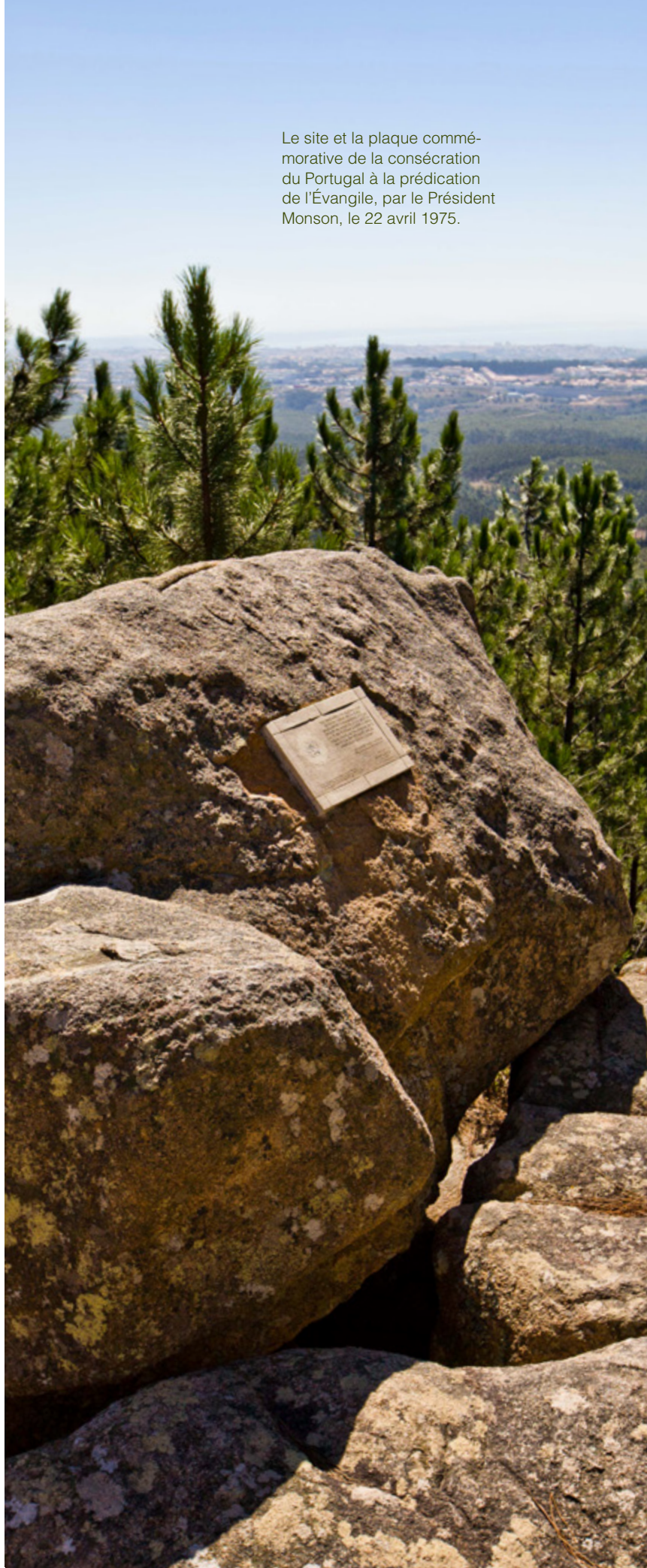
Le site et la plaque commémorative de la consécration du Portugal à la prédication de l'Évangile, par le Président Monson, le 22 avril 1975.