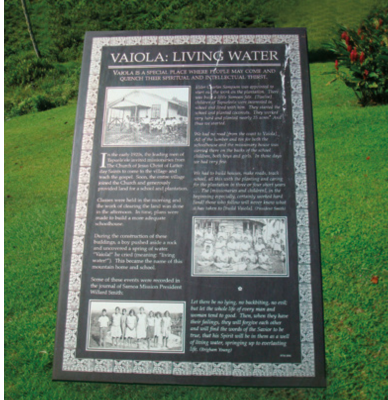
Panneau à Vailola, aux Samoa.

Le personnel du département d'Histoire de l'Église préparera la demande d'examen adressée au Comité exécutif des sites historiques, ainsi que