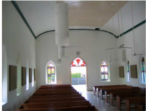
Inside the chapel looking toward the front door