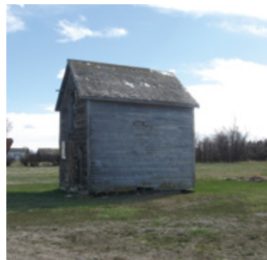
Certains des premiers membres de l'Église en Amérique du Nord payaient leur dîme en nature. Il s'agit d'une « grange de la dîme » utilisée à Raymond (Alberta, Canada), pour entreposer les dons.