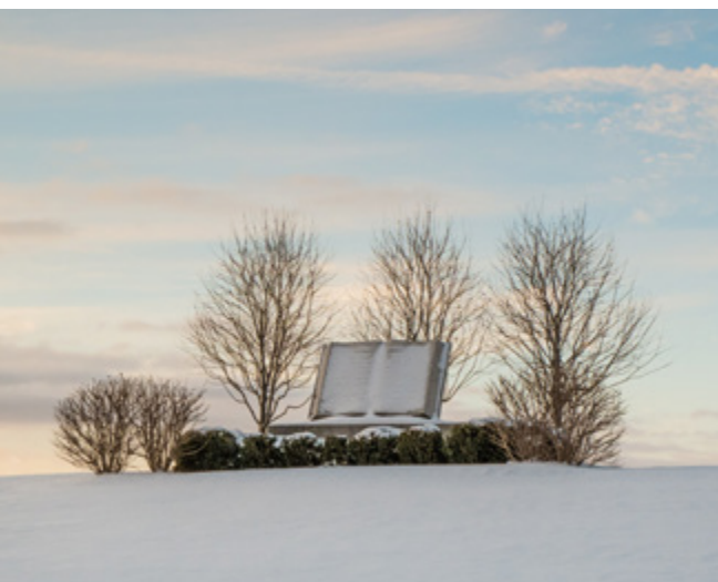
Book of Mormon Monument, colline Cumorah, État de New York, États-Unis.