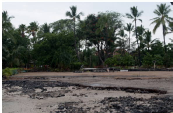
View looking south

Take as many photographs as needed to adequately document the place. Include the photographs with this report.