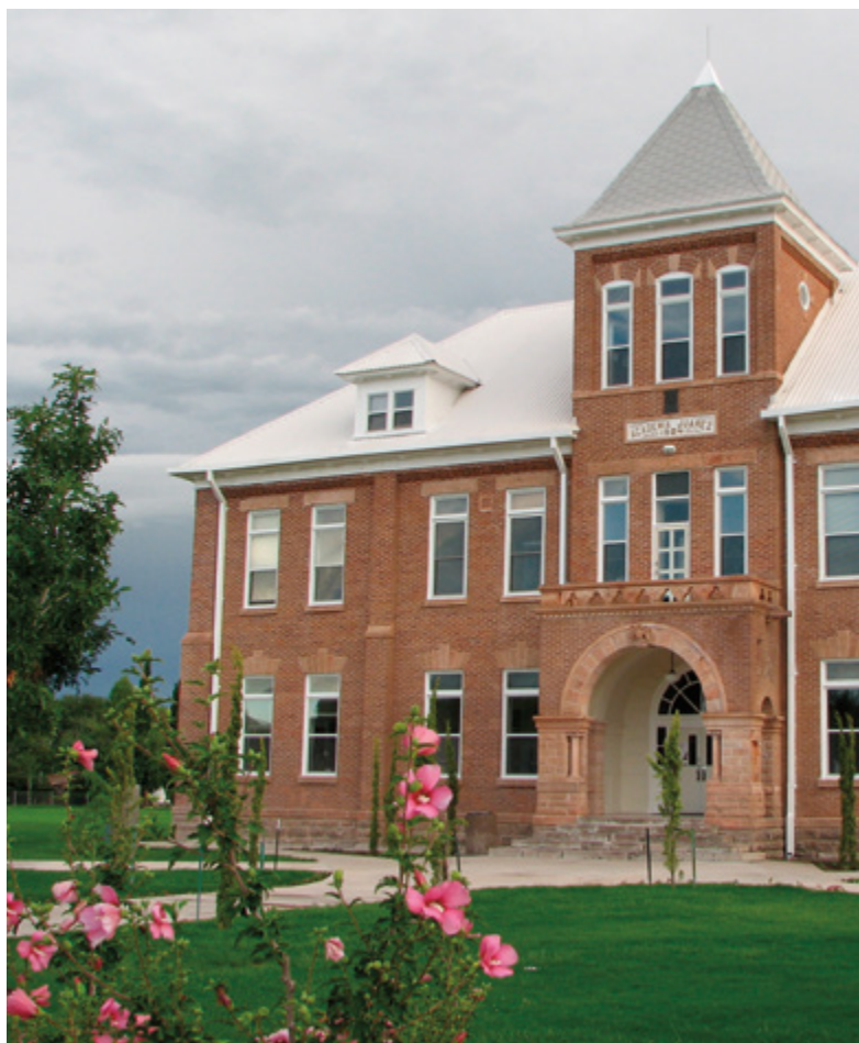
Le bâtiment Academia Juarez, figure sur la liste des monuments historiques de l'Église.