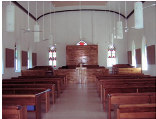
Inside the chapel looking at the podium