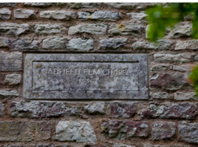
Panneau de la chapelle de Gadfield Elm, en Angleterre.