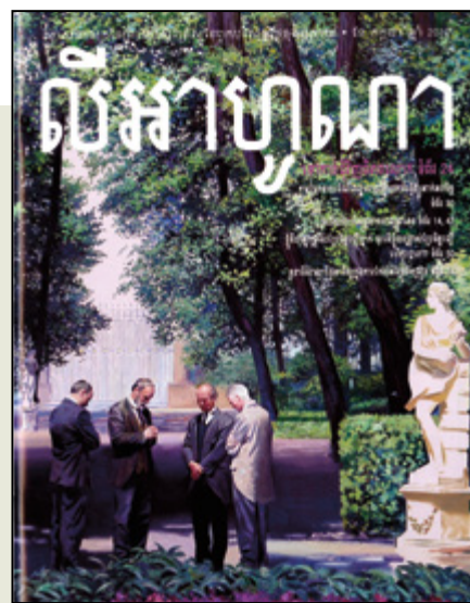
Cet article du Liahona donne des renseignements sur la consécration de la Russie.

Envisagez les possibilités suivantes afin de préserver et de promouvoir les sites historiques