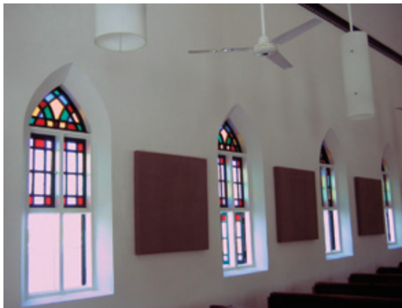
Beautiful stained-glass windows