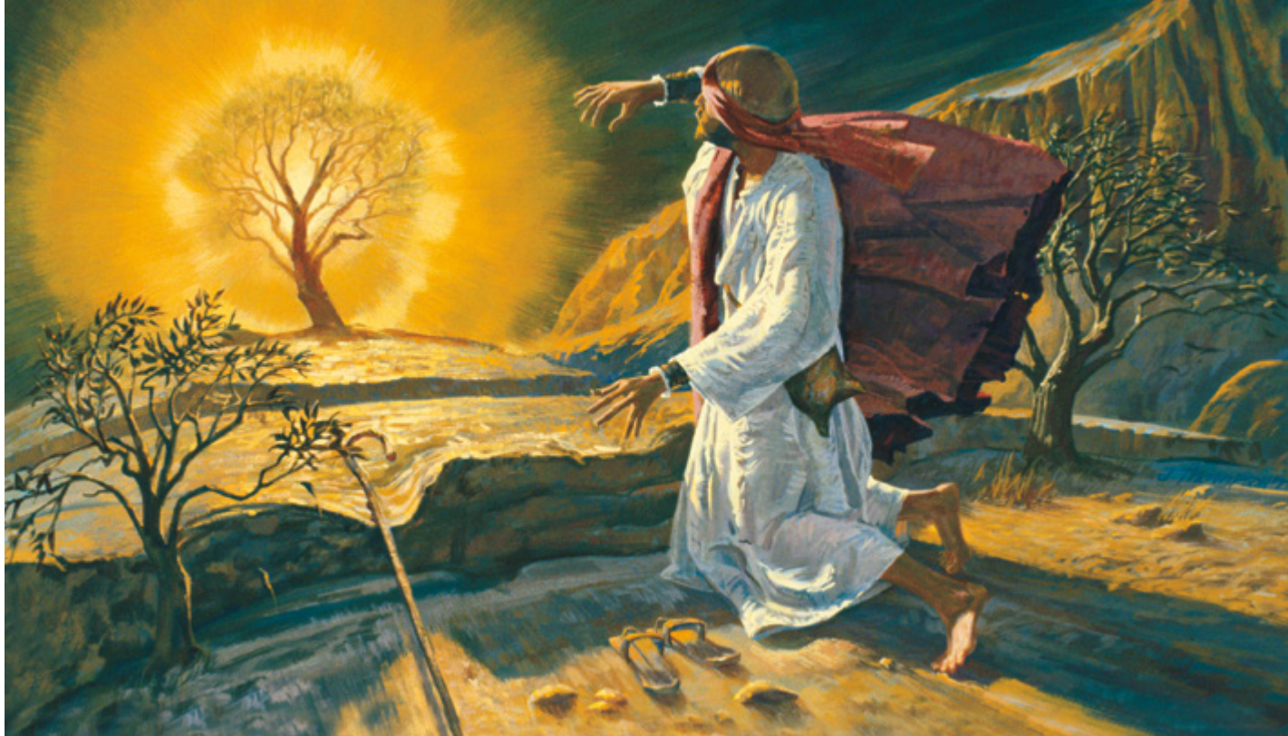
L'histoire de Moïse et du buisson ardent illustre bien l'importance des lieux sacrés.

On peut en apprendre davantage en étudiant les Écritures et les recommandations suivantes :