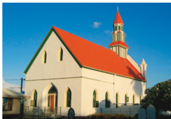
Back and west side