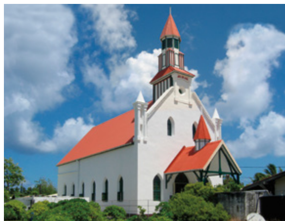
Front and east side

Take as many photographs as needed to adequately document the place. Include the photographs with this report.