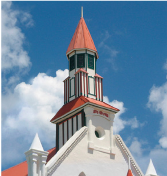
Close-up of steeple