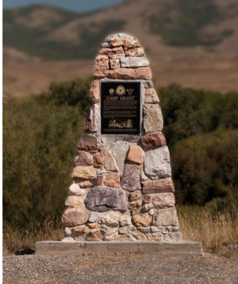
Un moyen de préserver et de promouvoir un site historique est d'installer un panneau de signalisation, comme celui qui se trouve le long du « Mormon Trail » à Emigration Canyon, près de Salt Lake City, Utah.

Suivre les cinq étapes de la procédure ci-dessous garantira que la documentation, la préservation et la promotion des sites historiques soient en accord avec les directives applicables et puisse profiter à tous les visiteurs.