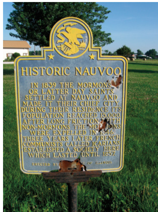
Les sites historiques mal entretenus peuvent donner une image négative de l'Église.

Pour les lieux où aucune mesure n'a été prise dans les étapes 3 et 4, prévoyez qu'une personne se rende sur place une fois par an pour surveiller leur état général.