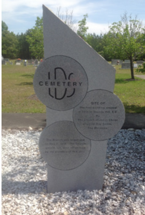
LDS Society Hill Cemetery en Caroline du Sud, États-Unis.