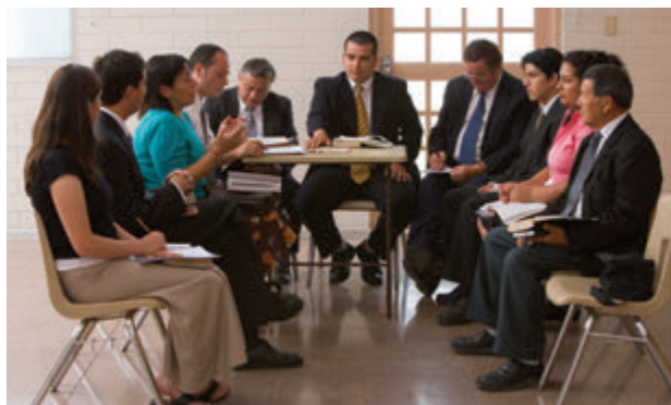
邀請支會議會成員為年度歷史提供資料。

聖職、輔助組織和成員報告。 年度歷史讓領袖有機會省思他們在幫助個人和家庭獲得超升方面所作的努力，這些報告是該單位歷史的重要部分。為幫助蒐集這項資料，單位的領袖可以擬出一套簡單的問題讓聖職和輔助