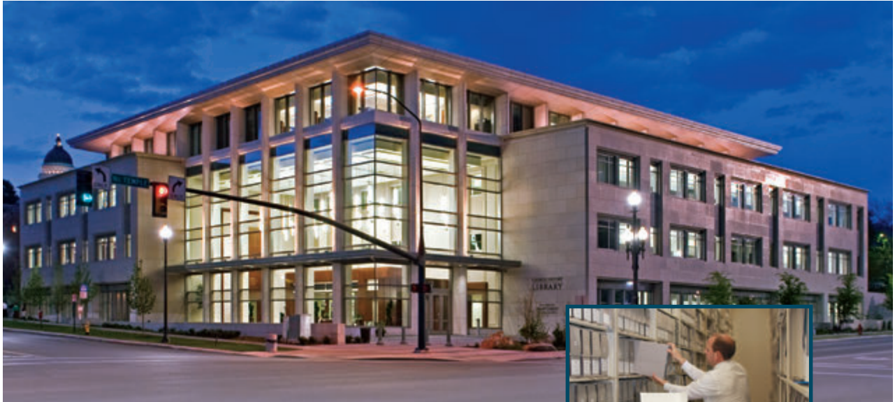
教會歷史圖書館，位於美國猶他州鹽湖城

準 備和提交支聯會、區會或傳道部年度歷史，有助於達成主的這項命令：「繼續……關於我教會的一切重要事務寫下來，……而且，我各地的僕人也應該把他們管家職務的報告，送〔來〕」（教約69：3，5）。