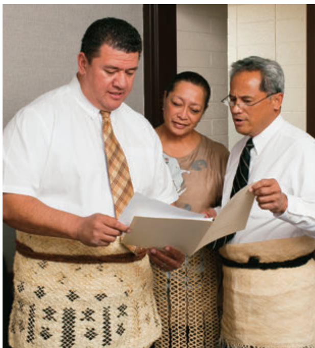
年度歷史提交前，要先由該單位的聖職領袖核准。

區域會長可調整這些日期，以符合其區域的需要。延遲提交的資料仍會予以受理，但由於年度歷史的編纂應在一整年中進行，因此最好能夠儘早完成上一年度的年度歷史，以便能專心處理本年度的歷史。當地單位可以保存一份年度歷史的副本，但這份資料不應廣為分發。