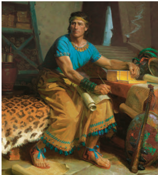
摩爾門在古代編纂的紀錄，成為後來各世代一項寶貴的祝福。

年度歷史幫助教會成員記得「主……做了何等偉大的事」（摩爾門經標題頁），藉此讓他們與基督更接近。知道他人在面對挑戰時曾藉著主的幫助而克服這些挑戰，會使我們的希望和信心增強。從歷史當中學習，能幫助我們避免重蹈覆轍，並帶來認同感和傳承。藉此方式，教會歷史能讓當今和未來的世代都蒙受祝福。