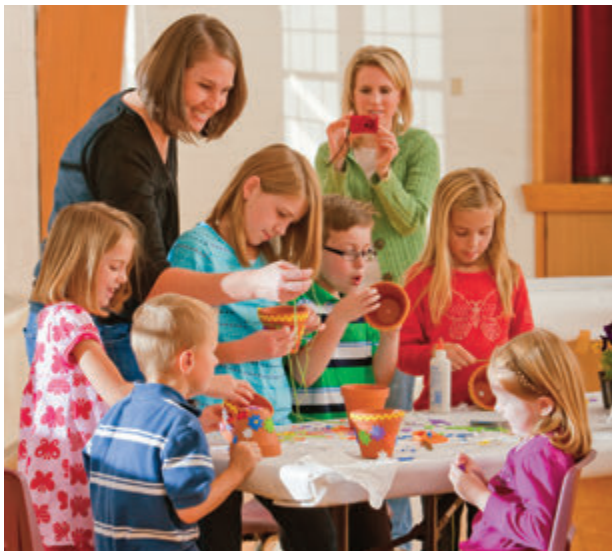
收錄能可充實書面報告內容的照片。

有些成員曾在生活中體驗到神的手的力量，年度歷史也可收錄這些重要的第一手記述（first-person accounts）。有關成員的生活方式、信心和行為的故事（見教約85：1-2），則可以運用記錄個人和家庭的靈性經驗範本來加以記寫，或寫成一篇簡單的敘述。（範本可在第9頁開始的「資源」單元或網站找到。）務必要收錄婦女和男女青年的經驗。個人的故事要有提交者的簽名，並要由編纂年度歷史的人詳加審閱，以確認內容是否可靠及合宜。