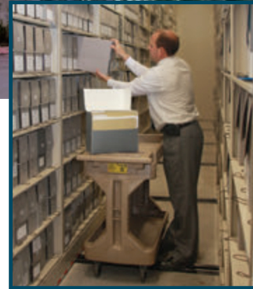
提交的年度歷史均在教會歷史圖書館存檔。