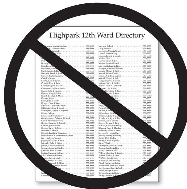
包含教會成員住址和電話號碼的通訊資料，不應收錄在年度歷史中。